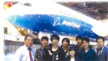
ボーイングのExternship Programに参加