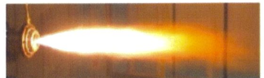
研究中のハイブリッドロケット

久留米工業大学工学部交通機械工学科に航空宇宙システム工学コースが設置されています。本学は、北部九州では航空宇宙工学を“いきなり”学べる唯一の私立大学です。