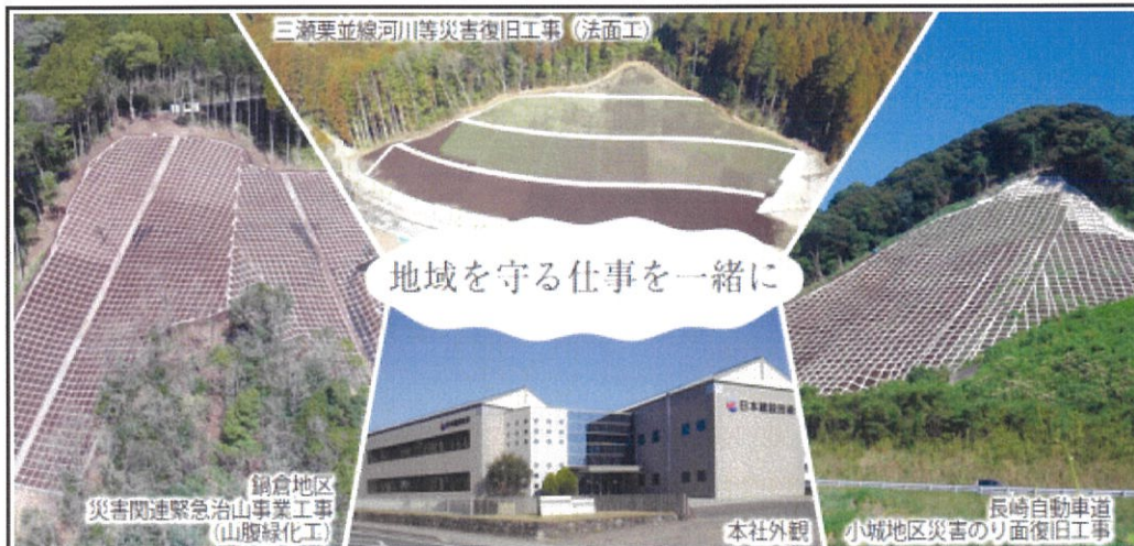
三瀬栗並線河川等災害復旧工事 (法面工)

〒847-0881 佐賀県唐津市竹木場5206番地82 TEL 0955-79-5555 FAX 0955-79-5551