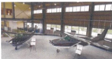
新設の航空宇宙実習棟内のセ スナ機(電動化の研究中)