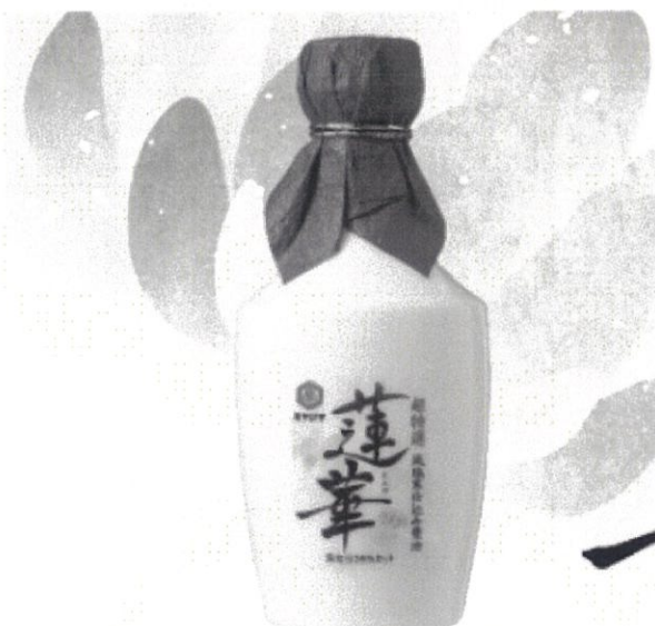
減塩寒仕込み醤油 蓮華 内容量：300ml